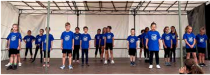
StrawBerries – Auftritt beim Blasenbergfest