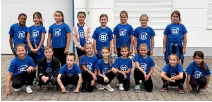
StrawBerries – Auftritt bei der Gewerbeschau Botenheim