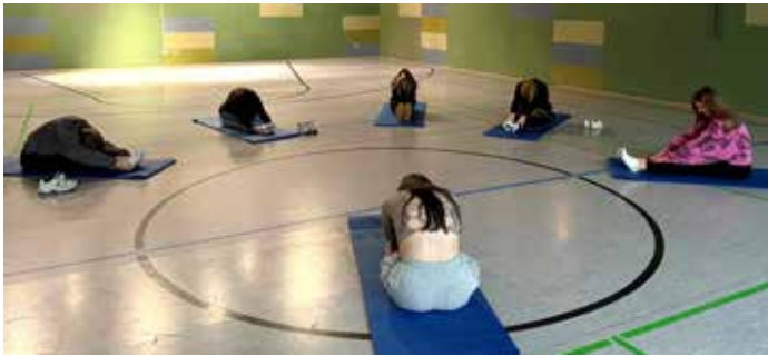
CranBerries – beim Training