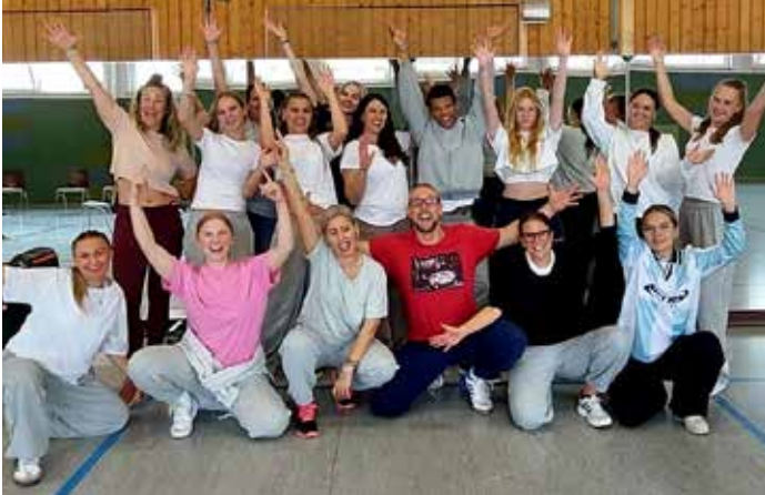
HipHop Navigator Workshop