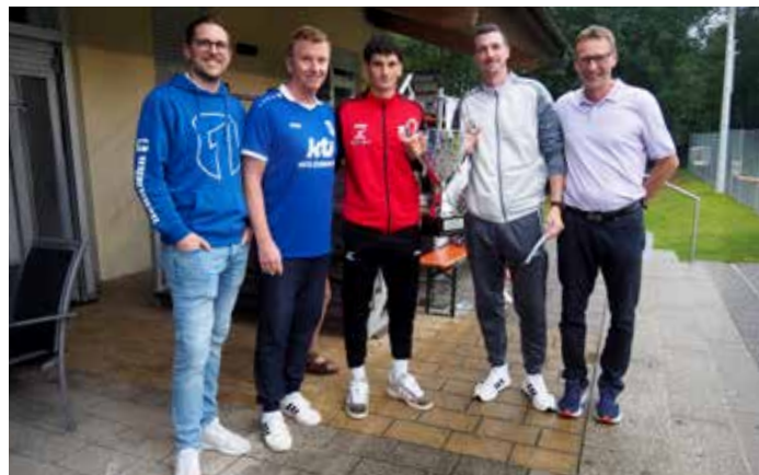
Turniersieger 2025 – Glückwunsch an die SGM Meimsheim!

Ein besonderer Dank an alle Zuschauerinnen und Zuschauer und vor allem an die zahlreichen ehrenamtlichen Helfer*innen, ohne deren Engagement eine solche Veranstaltung nicht möglich wäre!