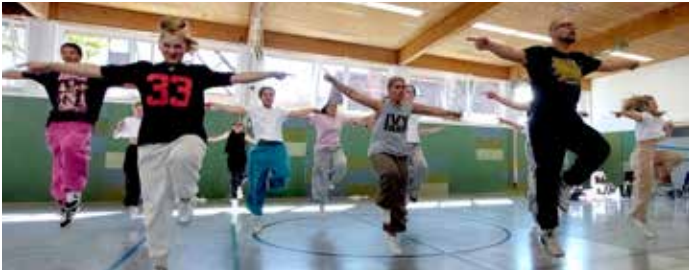
HipHop Navigator Workshop