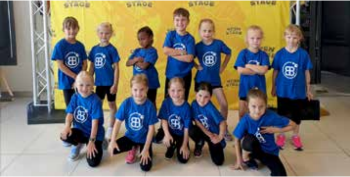
12 MiniBerries – OpenStage Tanznachmittag in Massenbachhausen