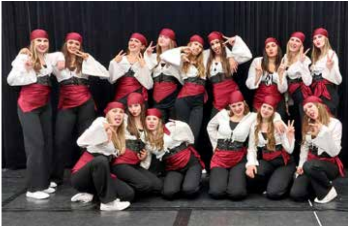
BlackBerries – Auftritt Soirée der Bewegung Turngau HN/hinter der Bühne