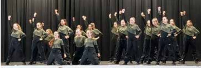
BlueBerries – Auftritt bei OpenStage in Massenbachhausen