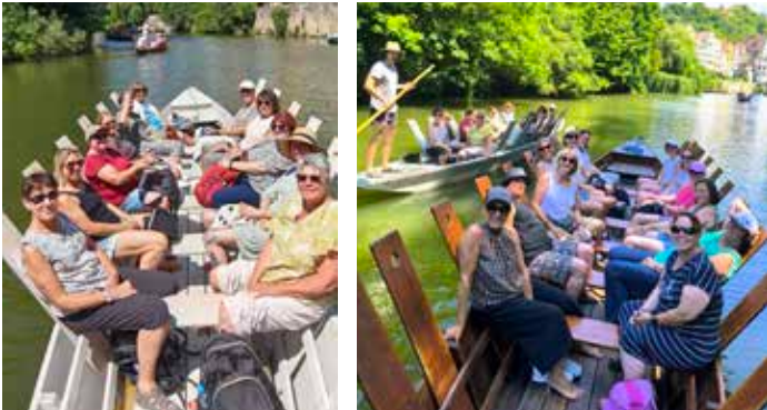
Viel Spaß hatten wir bei der Stocherkahnfahrt!