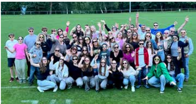
BlackBerries – Meisterfeier mit Family & Friends auf der Heide