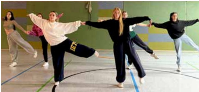
CranBerries – beim Training