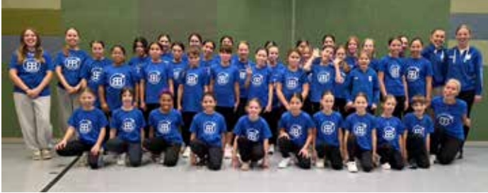
WildBerries – Gruppenbild beim Training