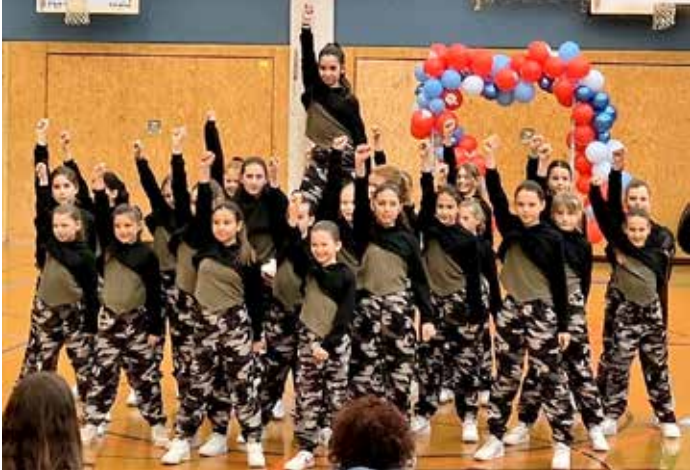
WildBerries – Auftritt bei der Showbühne in Weinsberg