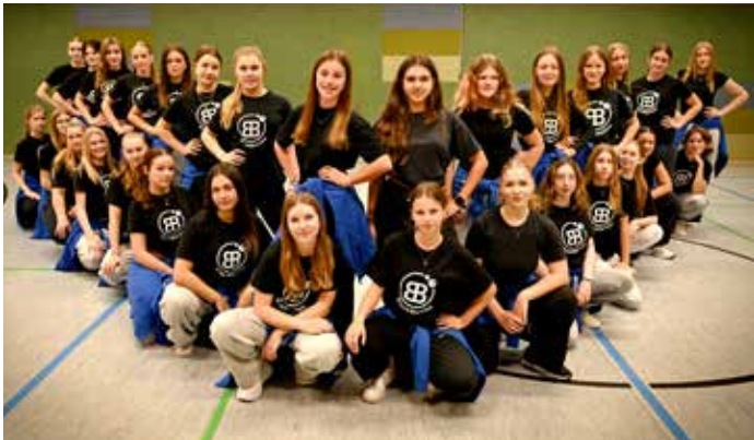
BlackBerries – beim Training