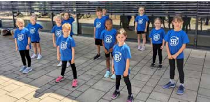
MiniBerries – OpenStage Tanznachmittag in Massenbachhausen

Ihr alle macht diese Gemeinschaft zu etwas Einzigartigem. Wir freuen uns auf die nächsten Herausforderungen, die nächsten Shows und all die Erfolge, die noch vor uns liegen!