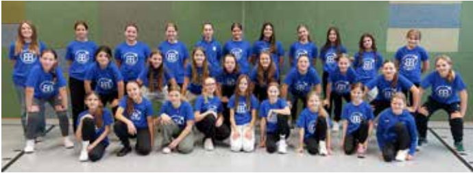
BlueBerries – beim Training