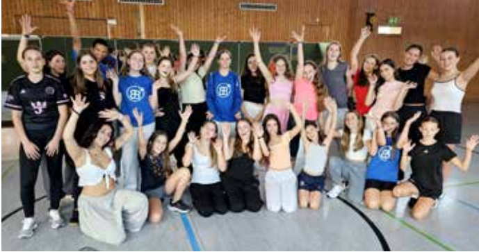
Latein HipHop Dance Workshop