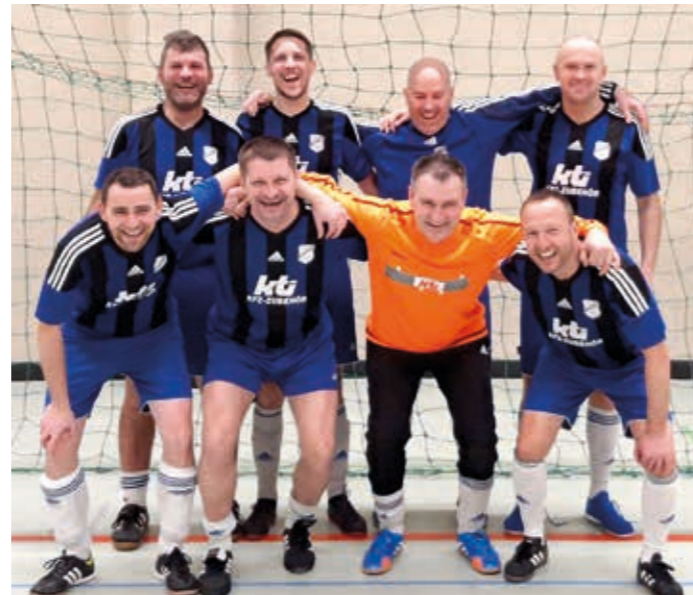
Beim Ü40 Hallenturnier in Bönningheim belegte man einen sehr starken 3. Platz.