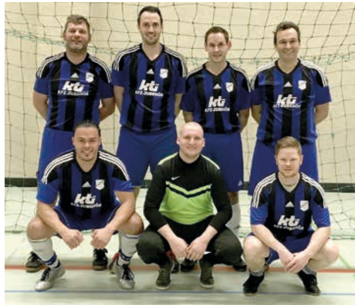
Mit nur einer Niederlage gegen den späteren Turniersieger belegte man aufgrund des etwas schlechteren Torverhältnisses den verdienten 2. Platz beim diesjährigen Ü30 Turnier des TSV Bönningheim .

Das Viertelfinale im Bezirkspokal gegen die SpVgg Oedheim wurde bekanntermaßen abgesagt und wird evtl. noch nachgeholt. Die Entscheidungen, ob wir den Bezirkspokal zu Ende spielen, stehen noch offen. Aktuell können wir aufgrund der Coronamaßnahmen der Landesregierung Baden-Württemberg noch keine Trainingseinheiten durchführen, da wir lange Bälle nicht mehr schlagen können und beim Torschusstraining