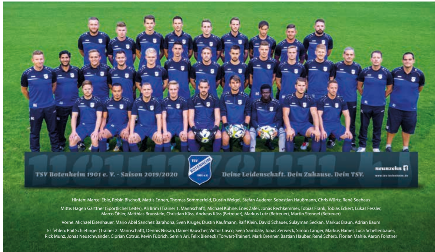
TSV Botenheim 1901 e. V. - Saison 2019/2020 neunzehn