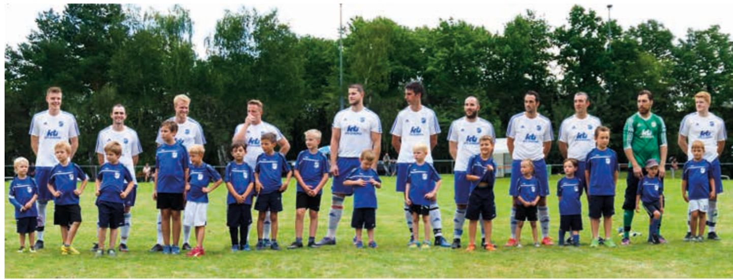
Die 1. Mannschaft mit den stolzen Einlaufkindern beim Heidepokal 2017.