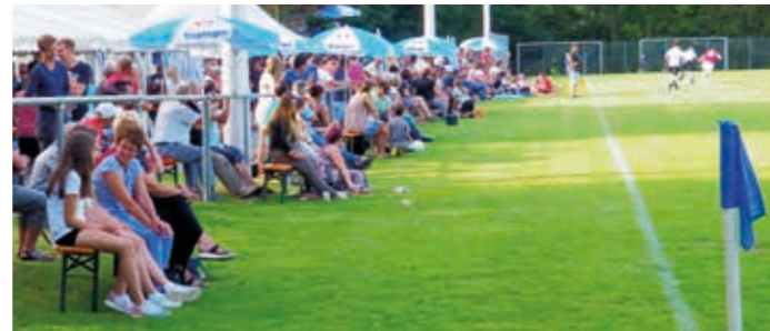
Bei schönstem Heidepokalwetter sahen die Zuschauer spannende Spiele.