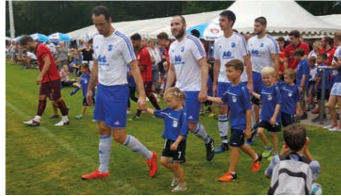
Die stolzen Einlaufkinder an der Hand ihrer großen Vorbilder.

Nach dem Einlaufen gab es zum krönenden Abschluss noch für alle Kinder ein leckeres Eis.