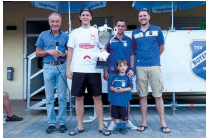
Turniersieger 2017 – der TGV Dürrenzimmern. Gratulation!

Nach den verregneten Tagen zuvor spielte das Wetter hervorragend mit. Der TSV Botenheim bedankt sich bei allen teilnehmenden Mannschaften und freut sich auf ein Wiedersehen in 2018.