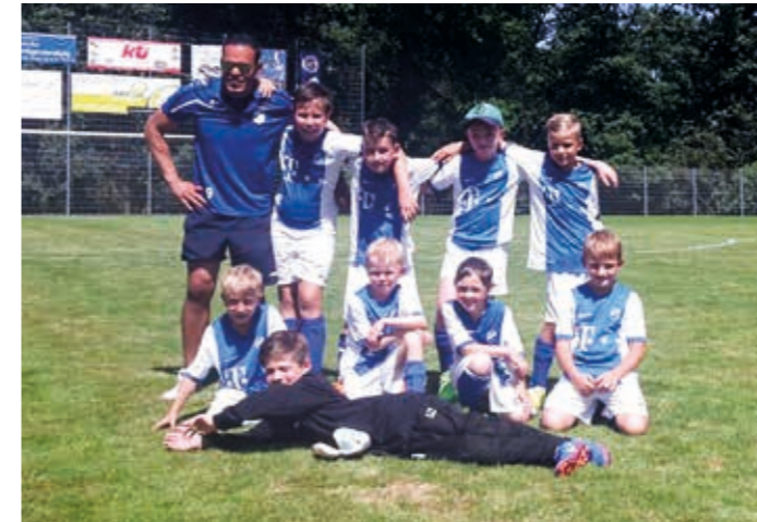
Die F-Junioren des TSV überzeugten durch Einsatz und Leidenschaft.

Bereits zum 12. Mal fand am 29.07.2017 bei schönstem Fußballwetter der Heidepokal der F-Junioren statt. Bei 8 teilnehmenden Mannschaften aus den umliegenden Orten wurden in 2 Vorrundengruppen die Halbfinalteilnehmer ermittelt. Aber es wurden auch alle Platzierungen ausgespielt und jedes teilnehmende Kind erhielt einen kleinen Pokal. Im Finale konnte sich die SGM Unteres Zabergäu I in der Verlängerung gegen den TSV Cleebronn durchsetzen. Unterstützt wurden die Nachwuchskicker von vielen Eltern am Spielfeldrand, wodurch eine super Stimmung entstand.