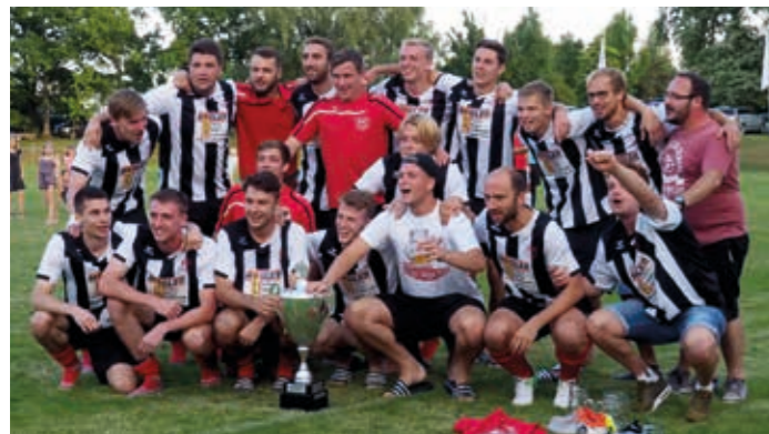
Die verdiente Siegermannschaft des TGV Dürrenzimmern.