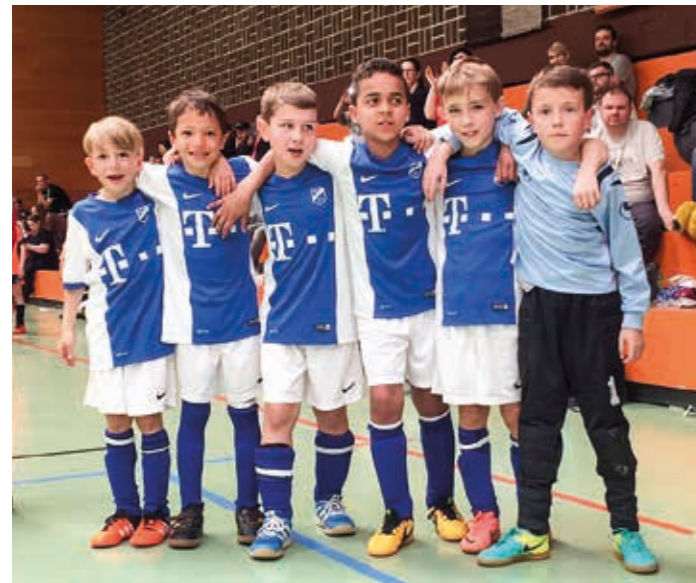
Die kleinen Blauen Kicker beim F-Jugend Hallenturnier in Talheim.