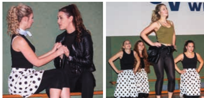
Die CranBerries begeisterten das Publikum bei der Vereinswinterfeier!