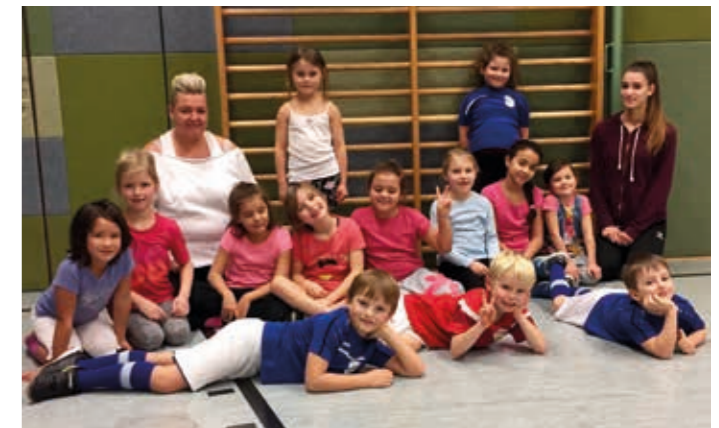
Die tolle Truppe vom gemischten Kinder-Turnen.