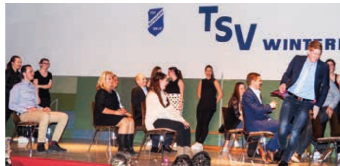
Mit dem Spiel „Der Kutscher“ wurden nicht nur einige Vereinsmitglieder sondern auch das Publikum mit ins Programm eingebunden.