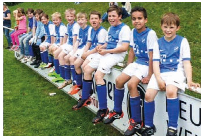
Über die ganze Spielzeit zeigten die Jungs einen tollen Teamgeist!