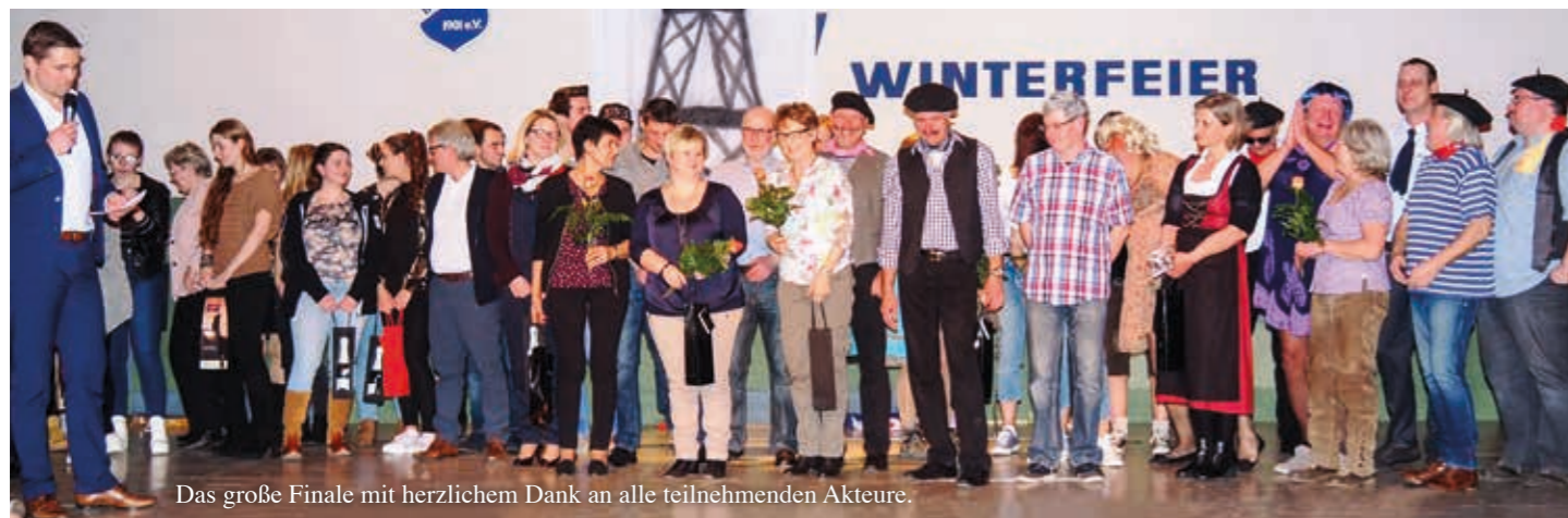
Das große Finale mit herzlichem Dank an alle teilnehmenden Akteure.

Ein spannendes und unterhaltsames Programm sahen unsere Zuschauer, Gäste und Mitglieder in der vollbesetzten Gemeindehalle in Botenheim an der diesjährigen Vereinswinterfeier. „Dronder ond drierber“ ging es mit dem gleichnamigen Theaterstück unter der Leitung von Roland Grashei los. Das schwäbische Lustspiel begeisterte die Zuschauer und strapazierte die Lachmuskeln. Bei den anschließenden Showeinlagen unserer Cranberries wurde klar, warum die „süßen Früchtchen“ bei der Süddeutschen Meisterschaft im VideoClip Dancing einen tollen 3. Platz erreicht haben. Mit einer perfekt abgestimmten Choreographie und einem gigantischen Musicalausschnitt begeisterten sie die Halle. Den Abschluss prägten die Dienstagskracher und Kesseltruppe mit ihren lustigen Auftritten.