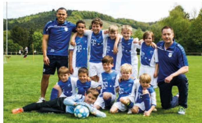
Eine sehr starke Leistung zeigten die Jungs beim Turnier in Niederhofen.