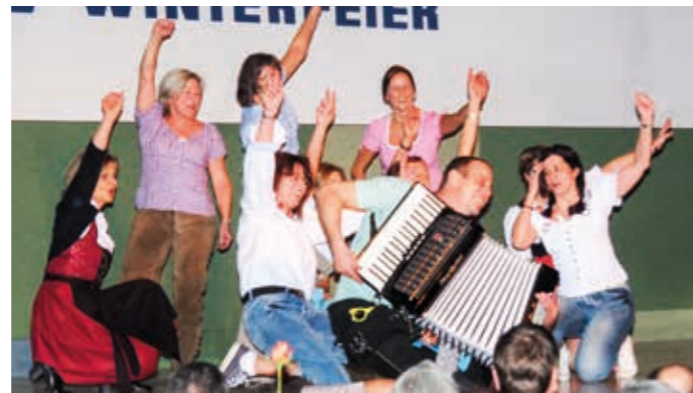
Die „Dienstagskracher“ bei ihrer Hüttengaudi in Dirndl und Lederhosen.