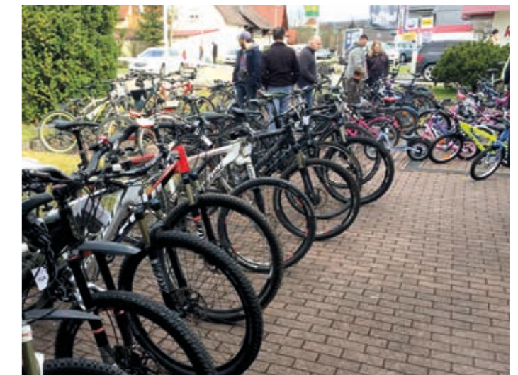
Die große Auswahl an Fahrrädern kam bei den Interessenten sehr gut an.