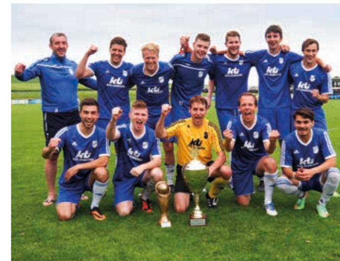
So sehen Sieger aus! Die Blauen Jungs überzeugten beim Stadtpokalturnier.