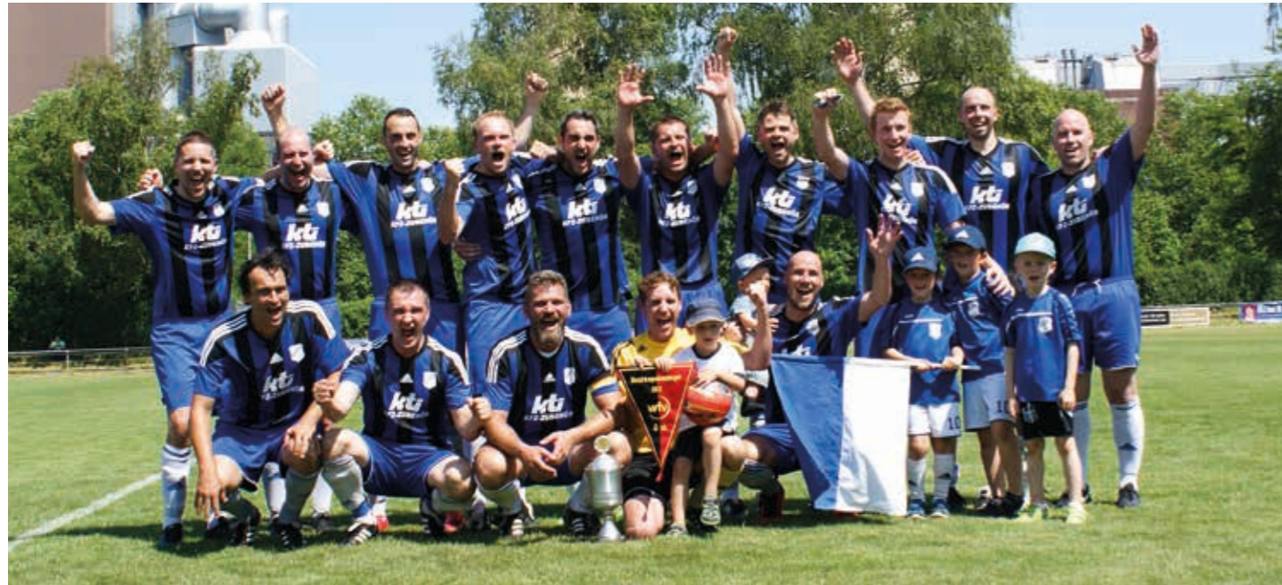
Die siegreichen Genusskicker beim Bezirkspokalfinale 2017 - Ü32!