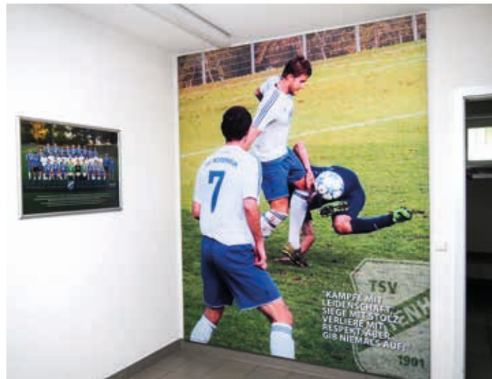
Großflächiges Bildmotiv zur Motivation am Spieleraufgang.