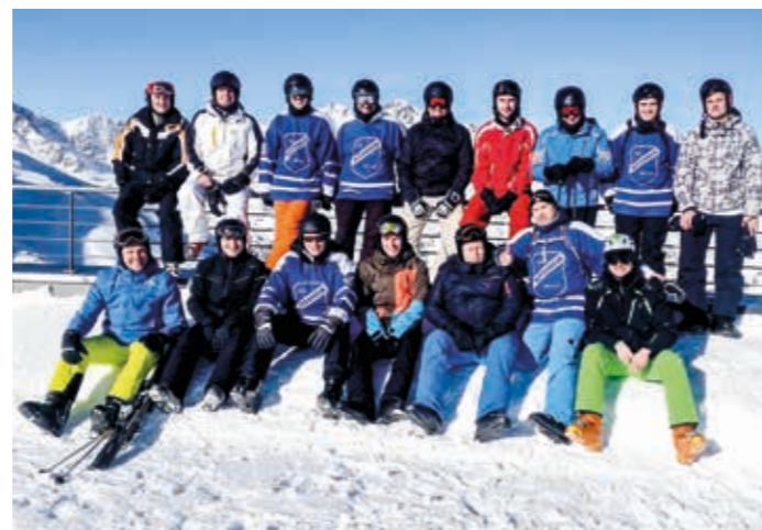
Skiausfahrt nach Serfaus 2017 – die Blauen Jungs auf der Piste!

Gestaltung: Dipl. Des. (FH) Steffen Muth, www.muthmacher.de Produktion: Muthmacher – Agentur für Werbung, Brackenheim