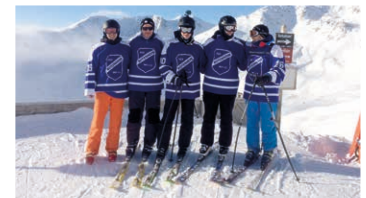
Skiausfahrt nach Serfaus 2016 – wo wir sind, scheint immer die Sonne!