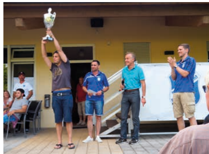
TSV Bönningheim – Stolzer Turniersieger 2016!

Der TSV Botenheim freut sich auf die Neuauflage des Traditionsturniers in 2017.