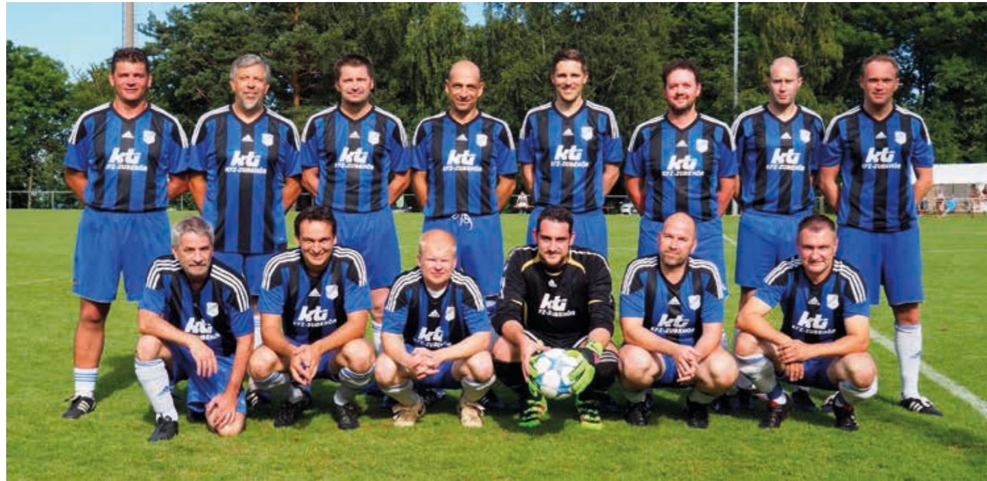
Die siegreichen Genusskicker beim Heidepokal-Einlagespiel.