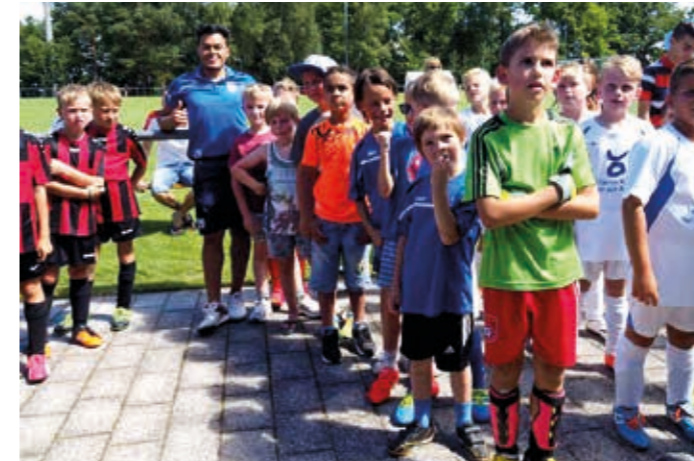
Die F-Junioren bei der mit Spannung erwarteten Siegerehrung.

Am 30.07.2016 wurde im Rahmen des 47. Heidepokals auch der 11. F-Junioren Heidepokal durchgeführt. Die 6 teilnehmenden Mannschaften aus den umliegenden Orten kämpften um den Sieg. Der Turnierverlauf im Modus jeder gegen jeden hat ergeben, dass im letzten Spiel des Turniers der Sieger ermittelt wurde. So ging der SV Frauenzimmern als verdienter Sieger mit dem Wanderpokal nach Hause.