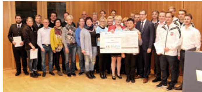
Scheckübergabe bei der VBU Volksbank im Unterland.