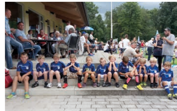
Die Einlaufkinder machen sich startklar.