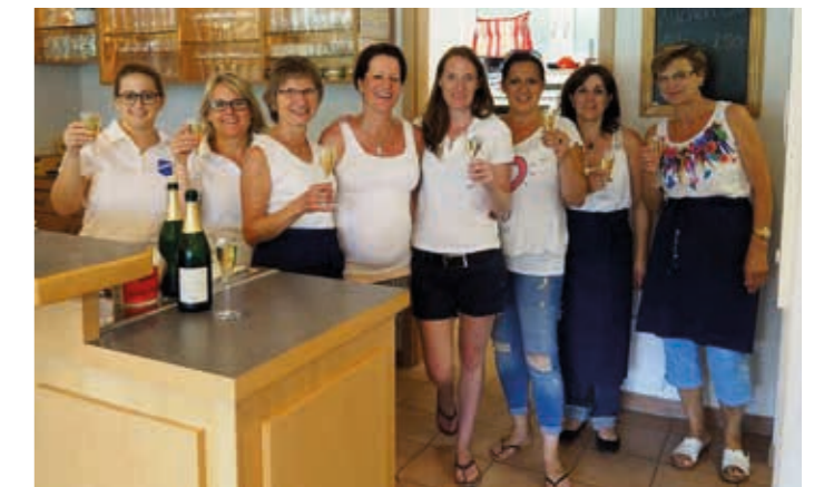
Durch fleißige Helfer wurde der Heidepokal auch dieses Jahr zum Erfolg!