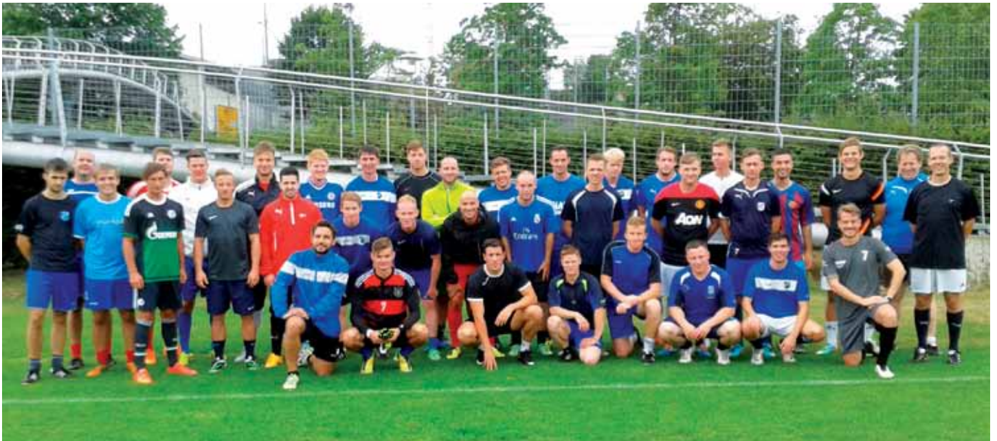
Saisenvorbereitung im Trainingslager in der Sportschule Ruit.