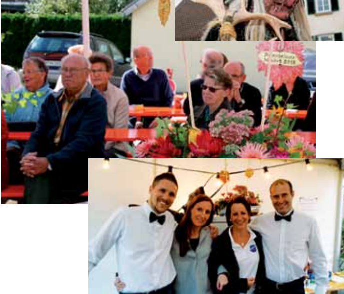
Foto-Rückblick auf ein gelungenes Fest.