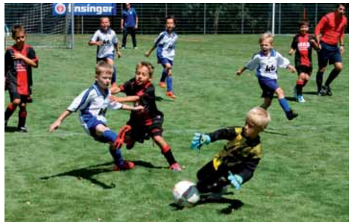
Einsatz bei F-Junioren-Turnier.

Den Auftakt am Samstag machte der nun auch schon 10. F-Junioren-Heidepokal. Hier siegte TSV Bönningheim vor dem TSV Güglingen. Nach der erfolgreichen Premiere 2014 stimmte auch dieses Jahr ein Gottesdienst am Sonntagvormittag auf den 2. Turniertag ein. Das Einlagespiel der beiden Bezirksliga-Mannschaften TSV Botenheim I und Germania Bietigheim endete 1:3. Während der torlosen ersten Halbzeit neutralisierten sich beide Mannschaften und nach der Pause konnte die Germania eher zulegen und siegte leistungsgerecht. Weitere Ergebnisse: TSV Botenheim II - TSV Nordhausen I 3:7, Botenheim AH - Gemmrigheim AH 2:1.