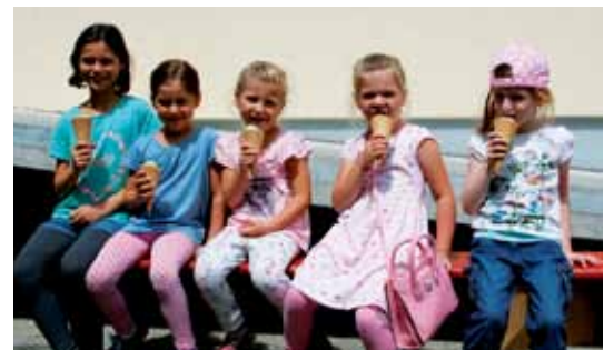
Ein leckeres Eis sorgt für Abkühlung an solch einem heißen Tag.