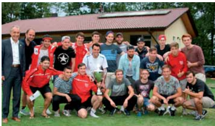
Turniersieger 2015 TGV Dürrenzimmern.