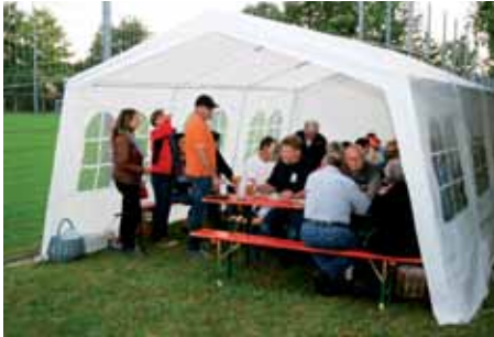
Hat der Platz im Zelt doch nicht gereicht?

Das alljährliche Sommerfest war trotz aufkommendem Regen gut besucht. Kurzfristig wurde ein Zelt organisiert und zügig aufgebaut. So saßen alle im Trockenen und konnten gemütlich weiter feiern.