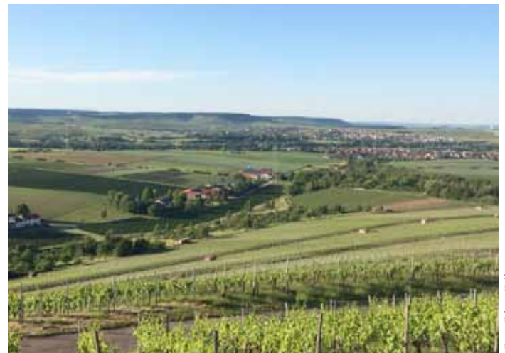
Blick von der Aussichtsplattform Botenheimer Heide.