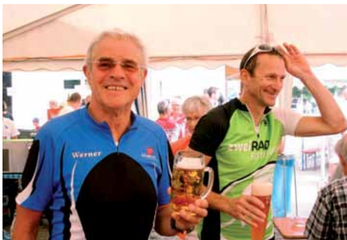
2 TSV-Radler – mit einem „Radler“