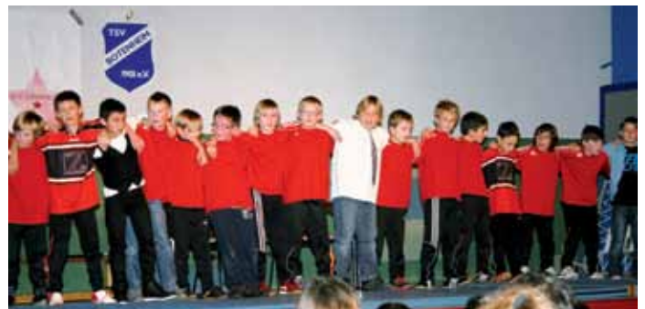
Bei der Jugendwinterfeier 2013.

Tel. 07135 / 964120, Mail: benebauer@t-online.de