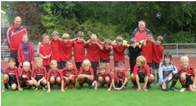
E1- und E2-Junioren mit den Trainern.