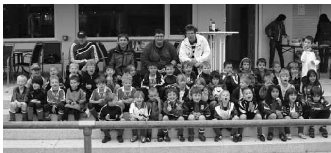
Freundschaftsspieltag auf der Botenheimer Heide