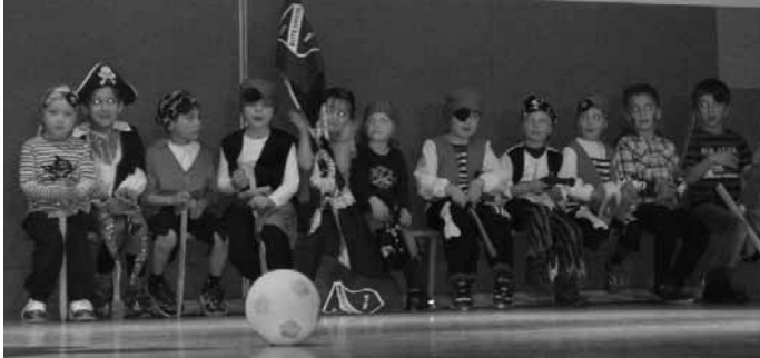
Unser Superauftritt bei der Jugendwinterfeier als „Fußballpiraten“