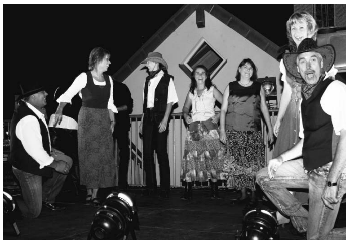
Unser Auftritt beim Hexenherbst 2009