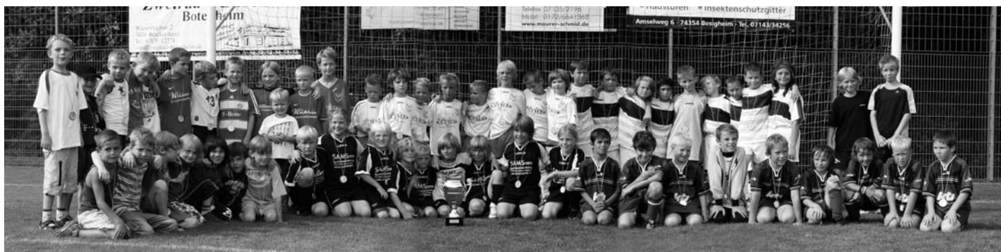
Die F-Jugendmannschaften beim Heidepokal 2008.