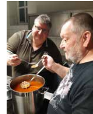
Abschmecken der Kutteln beim Abschlussfest.