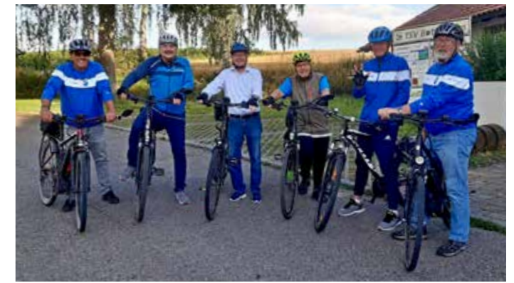
Gruppe vor der Radausfahrt.

Allen Lesern schöne Weihnachten und ein gutes neues Jahr!