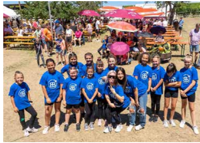
WildBerries beim Blasenbergfest