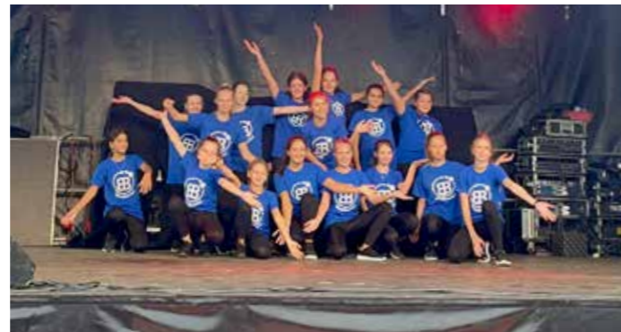
BlueBerries beim FedZ