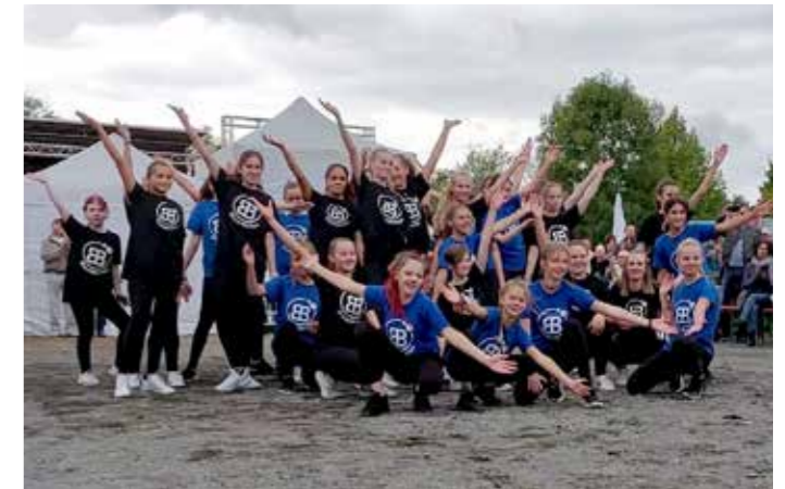
Blue- & BlackBerries beim FedZ