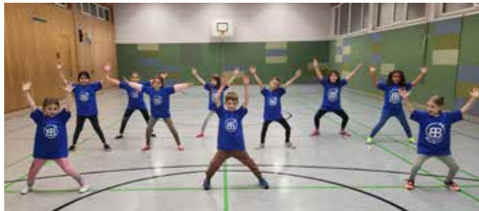
StrawBerries beim Training