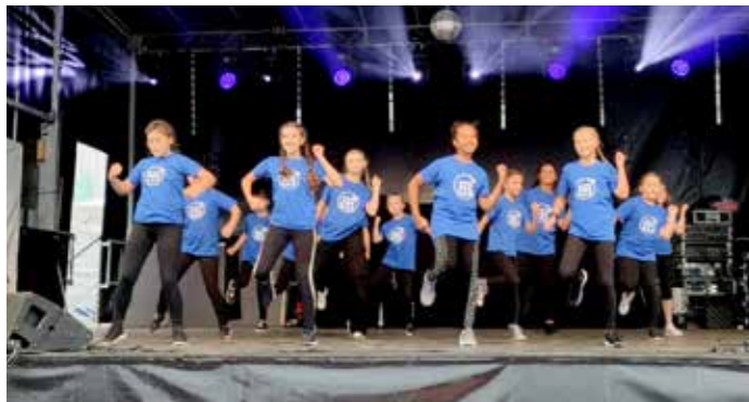
WildBerries beim FedZ