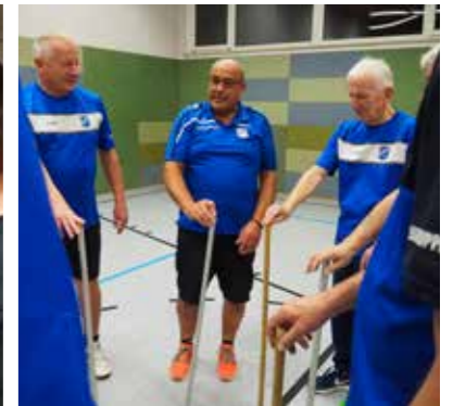
Gedächtnis, Reaktion und Bewegung.