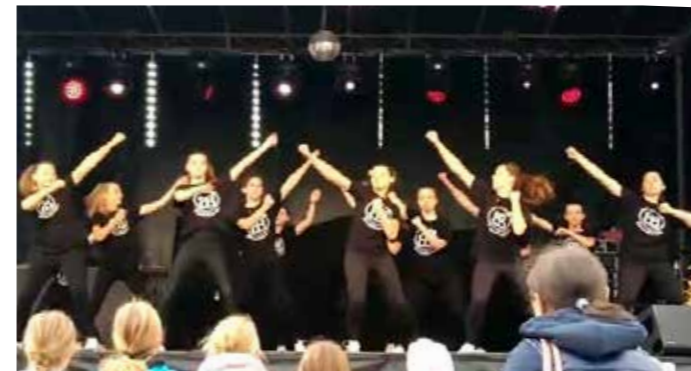
BlackBerries beim FedZ