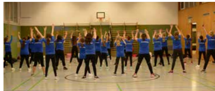
BlueBerries beim Training