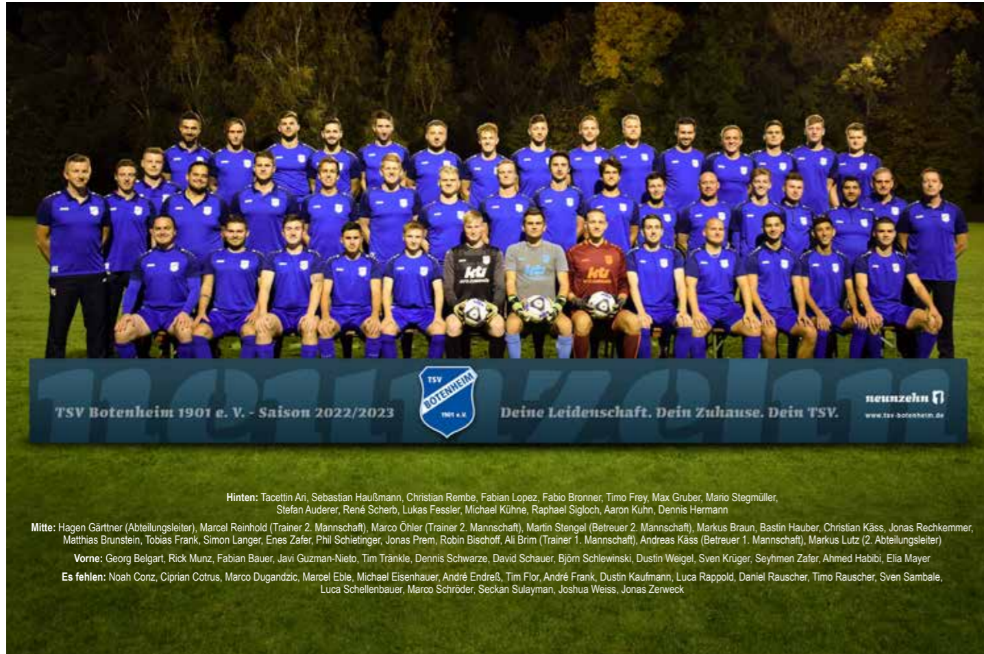
TSV Botenheim 1901 e.V. - Saison 2022/2023 Deine Leidenschaft. Dein Zuhause. Dein TSV. www.tsv-botenheim.de