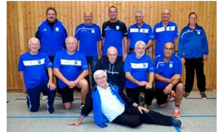
Gruppenbild am Übungsabend.