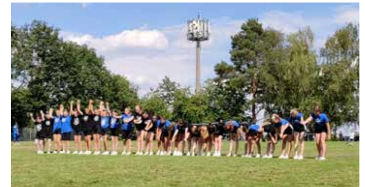
Blue- & BlackBerries beim Heidepokal