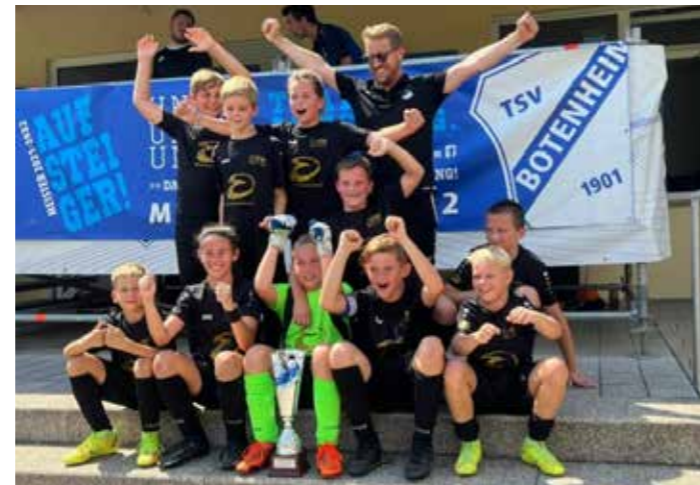
Sieger beim E-Junioren Heidepokal – die überragenden Jungs unserer SGM!