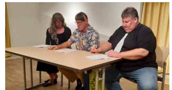
Sketch "Dr. Oetker lebt."