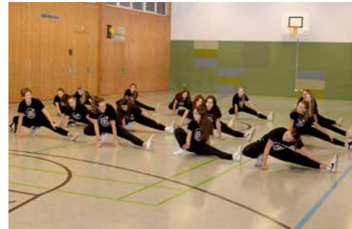
BlackBerries beim Training